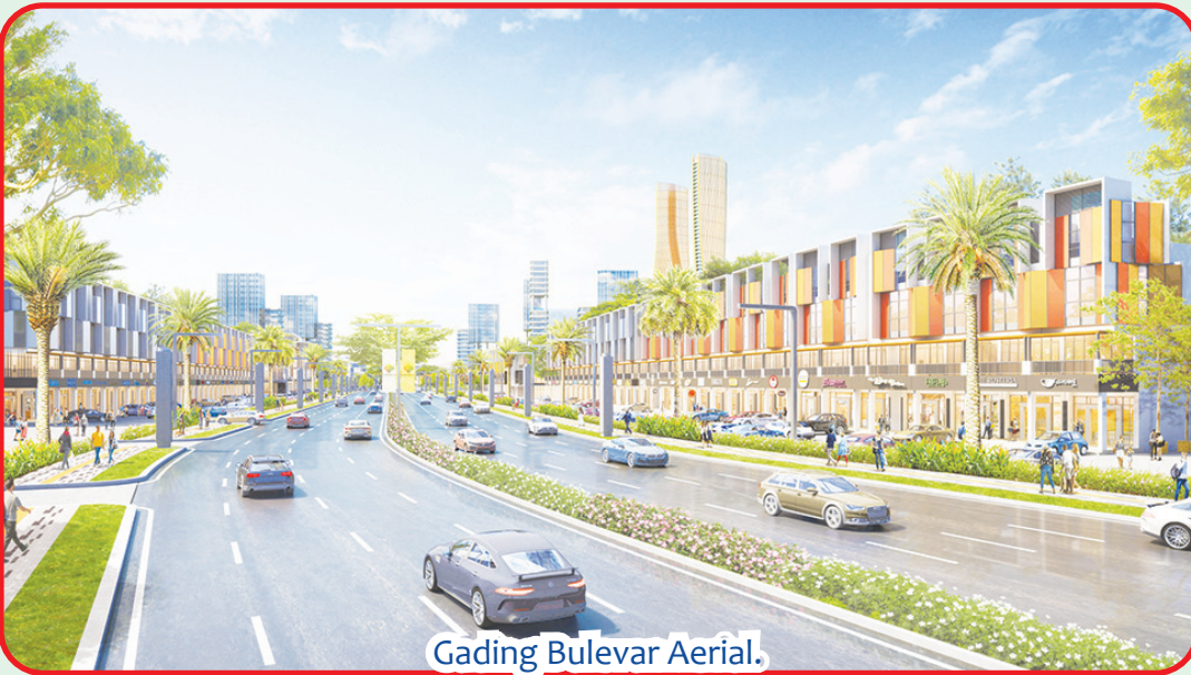
Gading Bulevar Aerial.

Dengan bangunan komersial 3 lantai yang modern dan unik, Gading Bulevar Commercial tampil dengan fasad yang eye-catching dan elegan, fasad menyatu hingga roof top, dengan crown di bagian atasnya, memberikan kesan tinggi seperti bangunan 4 lantai dan megah. Konsep outdoor terrace & balcony, membuat pengunjung nyaman ketika berkunjung ke area Gading Bulevar. • kris