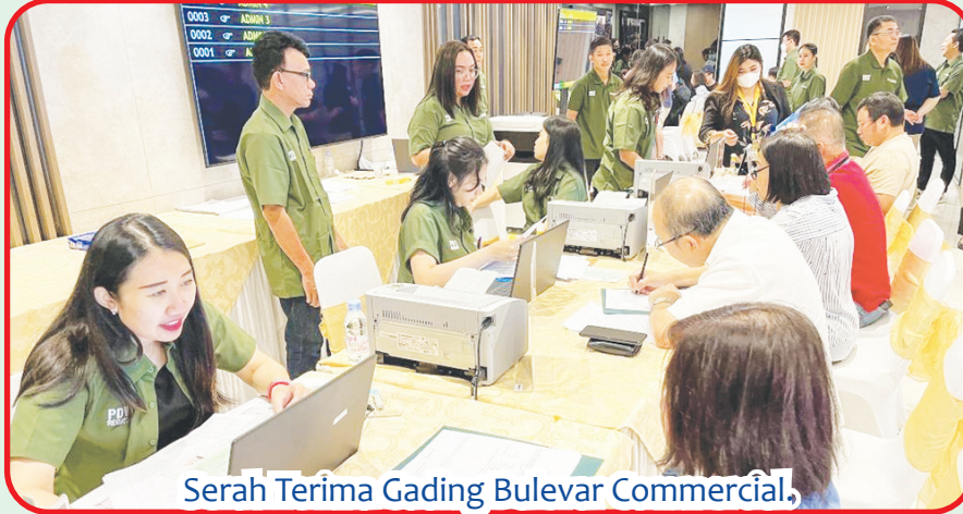
Serah Terima Gading Bulevar Commercial,

"Bersyukur antusiasme terhadap produk terbaru kami ini sangat tinggi, sehingga penjualan berlangsung hingga tahap 3 dengan total revenue yang berhasil