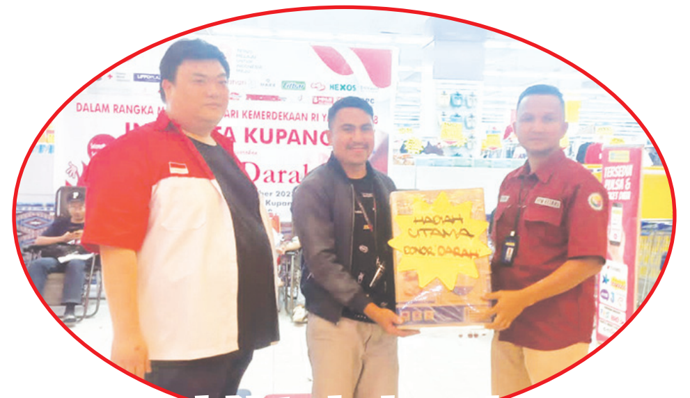
Penyerahan hadiah utama kepada peserta donor darah.

KUPANG (IM) - Masih dalam Peringatan HUT ke-78 Kemerdekaan Republik Indonesia, pengurus Perhimpunan INTI (Indonesia Tionghoa), Jumat (1/9) lalu menggelar bakti sosial berupa donor darah, di Lippo Plaza Kupang.