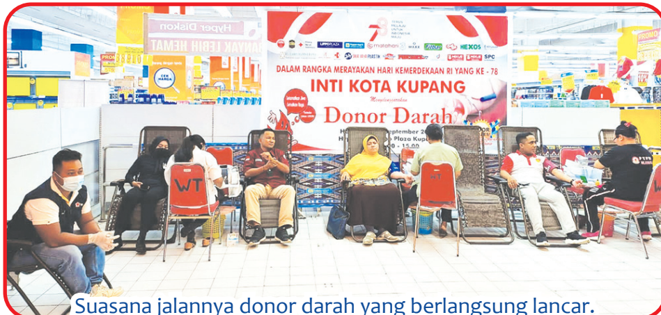
Suasana jalannya donor darah yang berlangsung lancar.

INTI merupakan sebuah organisasi yang bergerak di bidang