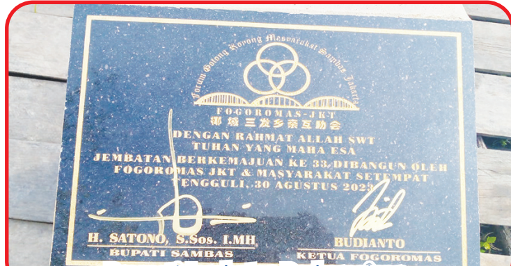
Prasasti Jembatan Berkemajuan.