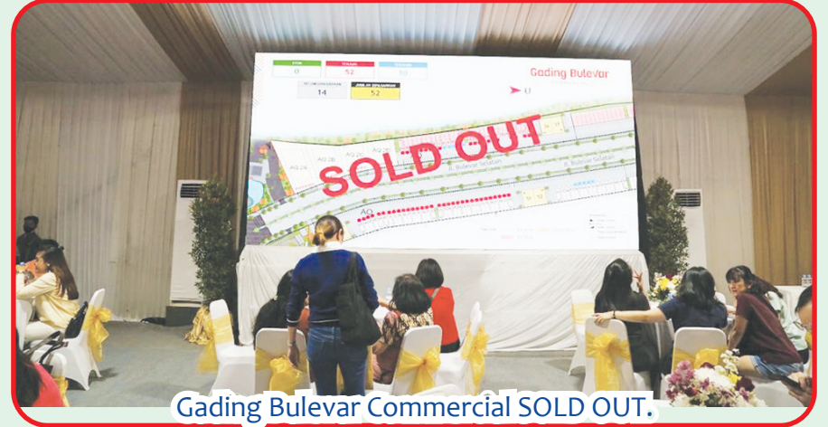
Gading Bulevar Commercial SOLD OUT.