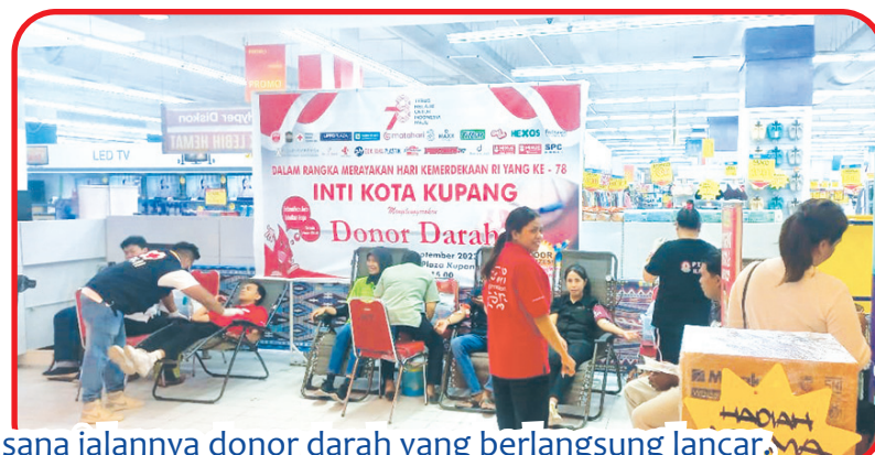
Suasana jalannya donor darah yang berlangsung lancar.