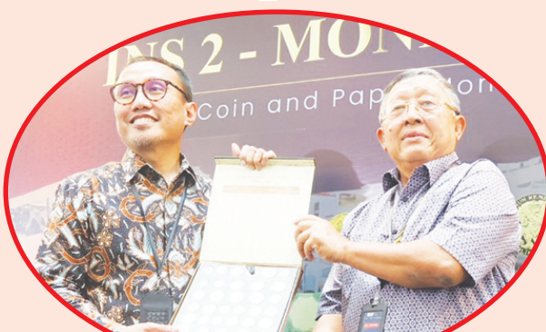
Penyerahan koleksi koin.