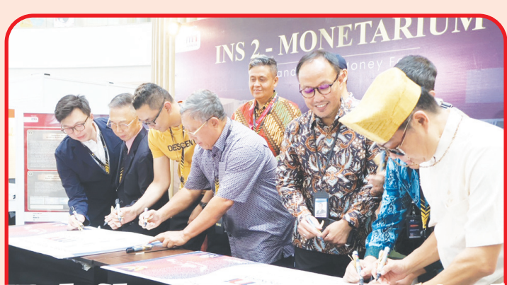
INS 2 berfokus untuk unjuk kebolehan numismatik Indonesia di kancah internasional.

INS 2 - MONETARIUM juga akan menyelenggarakan