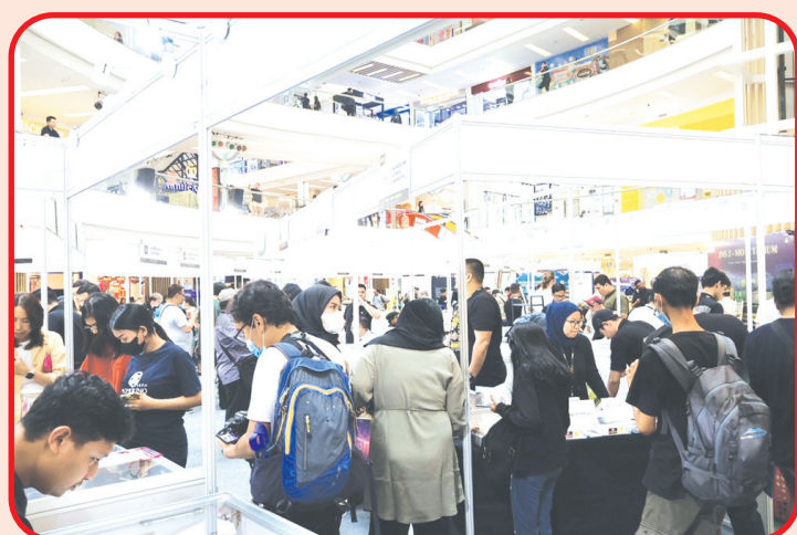
Masyarakat antusias terhadap numismatik melalui kegiatan INS ini.

MNI juga membagikan koin kuno gratis bagi pengunjung sebagai souvenir acara INS 2 - MONETARIUM.