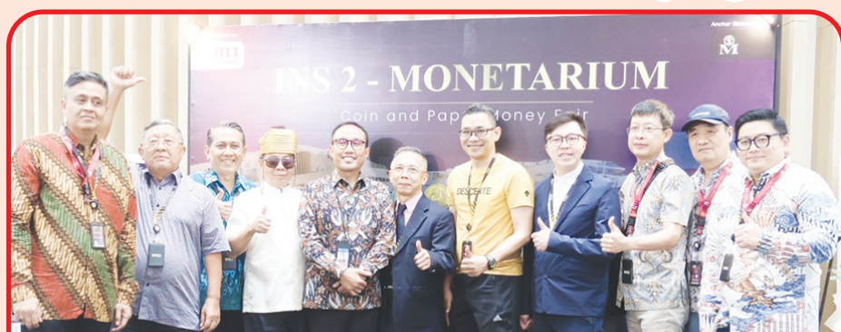
Panitia penyelenggara dan tamu kehormatan berfoto bersama pada pembukaan Pameran Numismatik.