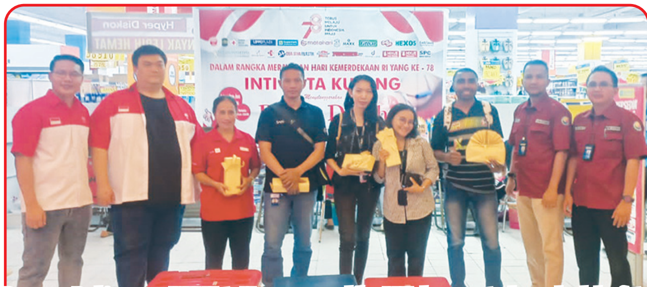
Pengurus Perhimpunan INTI Kota Kupang, perwakilan PMI dan peserta donor darah berfoto bersama.